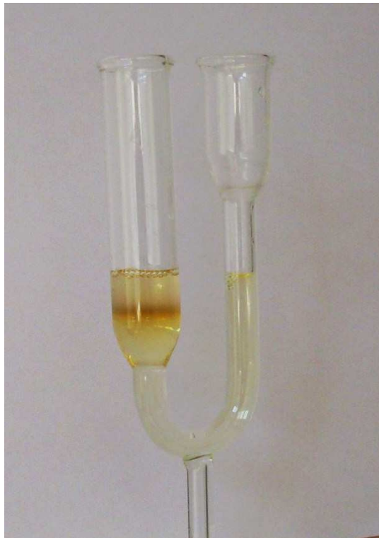
Leberstörung (brauner+gelber Ring) und Übersäuerung (Schaum) bei täglicher Einnahme von 1 l Cola seit mehr als 10 Jahren